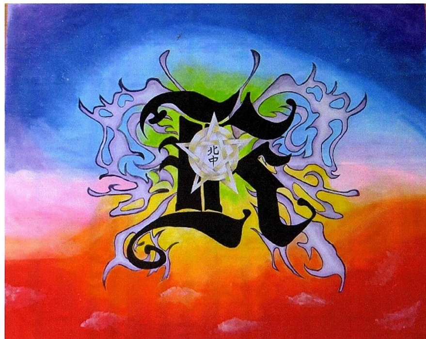
「北中感謝祭シンボルマーク」